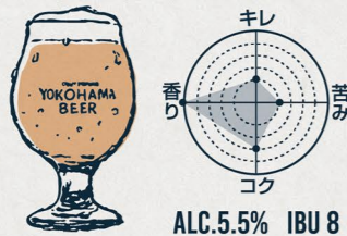
ヴァイツェン HEFE WEIZEN

"黒ビールのイメージを覆す軽快さ" 苦みは極力抑えて、アルコールも低め。 IPAらしい柑橘のようなホップの香りと モルトのロースト感がほんのり残るテイストの黒ビール。