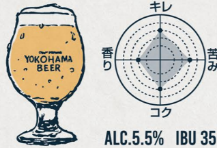
ピルスナー BOHEMIAN PILSNER

テイステイングセット BEER FRIGHT 2400 5 TYPES TASTING SET (150ml x 5p)