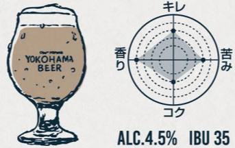
ハマクロ SESSION BLACK IPA

"香ばしい琥珀色のビール" ドイツデュッセルドルフ伝統の琥珀色のビール。 焼きたてのビスケットのようなローストされた麦の香ばしさ 酵母によるみずみずしくほのかに甘い香りが特長。