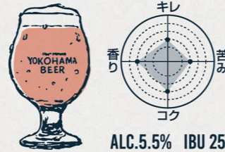
アルト DÜSSELDORF ALT

"心地よいホップの余韻が続く" 美しい黄金色のチェコスタイル・プレミアムビール。 コクのあるモルトのフレーバー、 チェコ産アロマホップの上品な香りと苦味が特長。