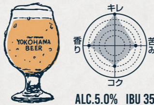
パールエール AMERICAN PALE ALE

"フルーティーな白ビール" 南ドイツのスタイル。酵母由来のバナナのような香り。 苦みが少なく、ビールを飲み慣れない 方からの人気も高い。