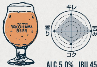
横浜ラガー INDIA PALE LAGER