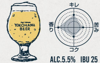
瀬谷の小麦 BELGIAN WHEAT ALE

"スッキリ爽やかな香りと苦み" 鼻に抜けるシトラス系の清々しいホップの香りと ほどよい苦みのバランスが絶妙で飲み飽きしない。 軽やかな口当たりでスイスイ飲めるビール。